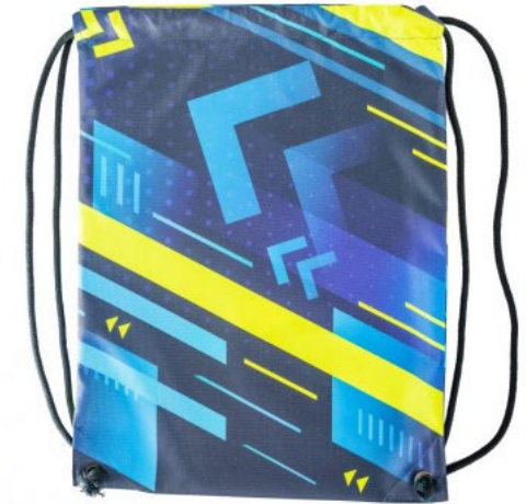
Jämäkkä urheilupussi, 100% polyesteri, 190 g. Paksut 6-8 mm nyörit, kulmissa tekonahkavahvikkeet. Pussin leveys 33 cm, korkeus 44 cm.