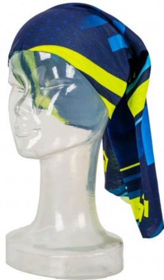
Ohut tuubihuivi, 100% polyesteri, 130 g. Huivin koko 25 x 50 cm.